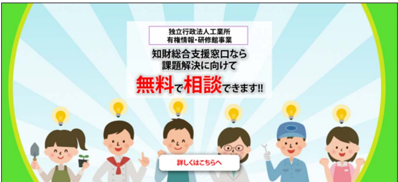
令和元年度 「知財総合支援窓口」（京都府） 紹介サイト https://chizai-portal.inpit.go.jp/madoguchi/kyoto/