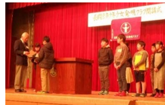
長岡京市少年少女発明クラブ閉講式