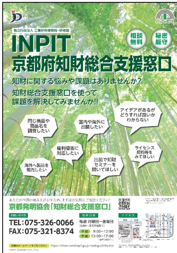
令和元年度 特許等取得活用支援事業（京都府） 「知財総合支援窓口」リーフレット（A3）