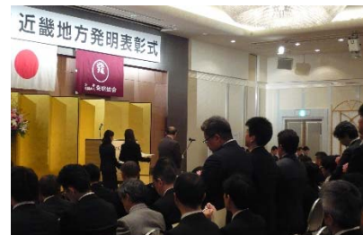
表 彰 文部科学大臣賞 2件 8名 特許庁長官賞 2件 13名 中小企業庁長官賞 2件 6名 近畿経済産業局長賞 2件 7名 発明協会会長賞 2件 5名 日本弁理士会会長賞 2件 5名 実施功績賞 11件 12名 知事賞 4件 11名 地域協会会長賞 21件 53名 発明奨励賞 86件 228名 奨励功労賞 4名