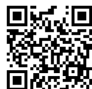
記念講演会 申込フォーム